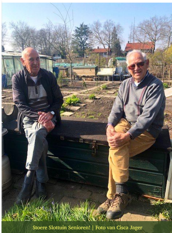
Stoere Slottuin Senioren!