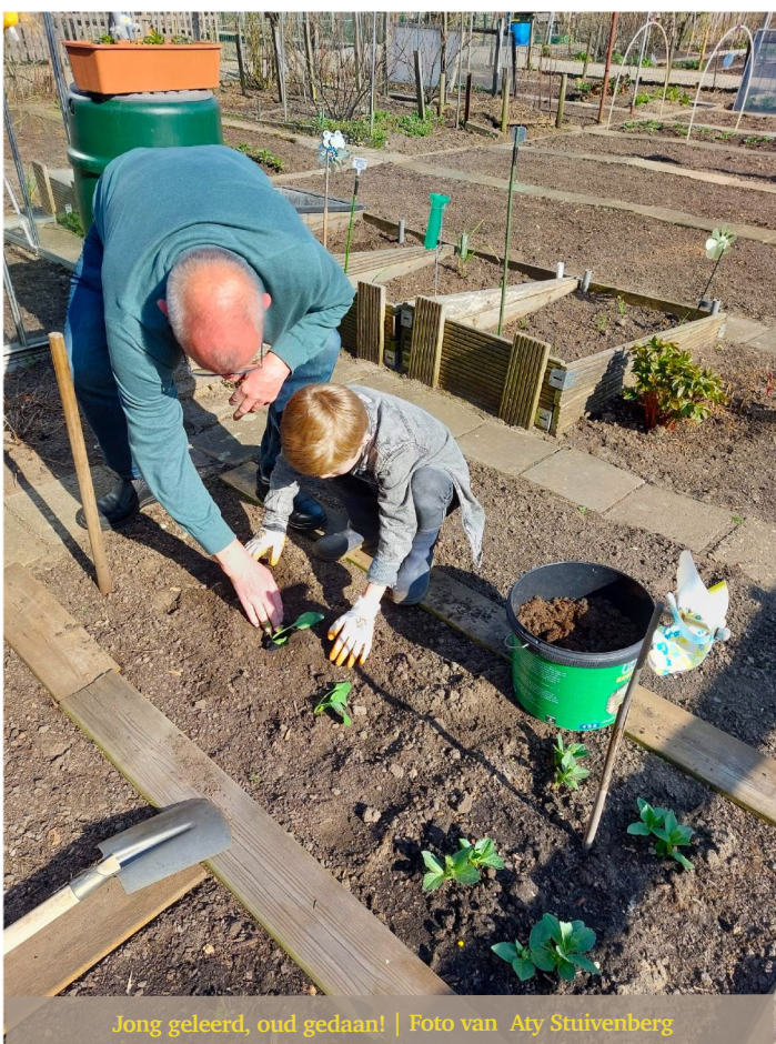
Jong geleerd, oud gedaan!